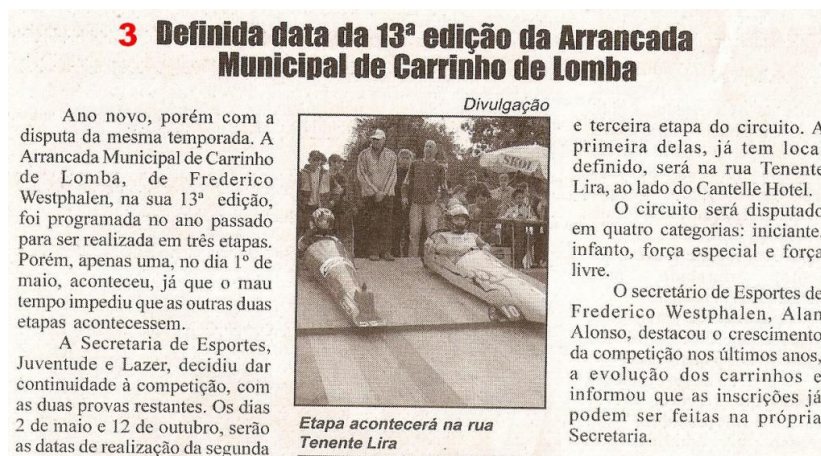
Figura 7 – Definida data da 13ª edição da Arrancada...