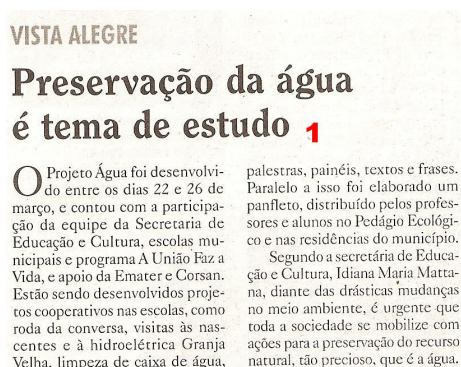
Figura 10 – Preservação da água é tema de estudo

Dentro das quatro edições do Jornal O Alto Uruguai, sendo elas de 07, 10, 14 e 17 de abril, foram publicados quatro relises. Na edição de 07 de abril um relise e na publicação do Informativo da edição de 10 de abril, foram mais três relises. Nas demais edições não houve nenhum relise publicado.