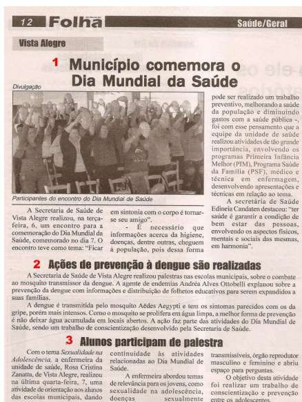
Figura 9 – Município comemora o Dia Mundial da Saúde

O Jornal Folha do Noroeste possuiu duas edições. Em 09 de abril foram três relises publicados; já na edição de 16 de abril não houve publicações de relises.