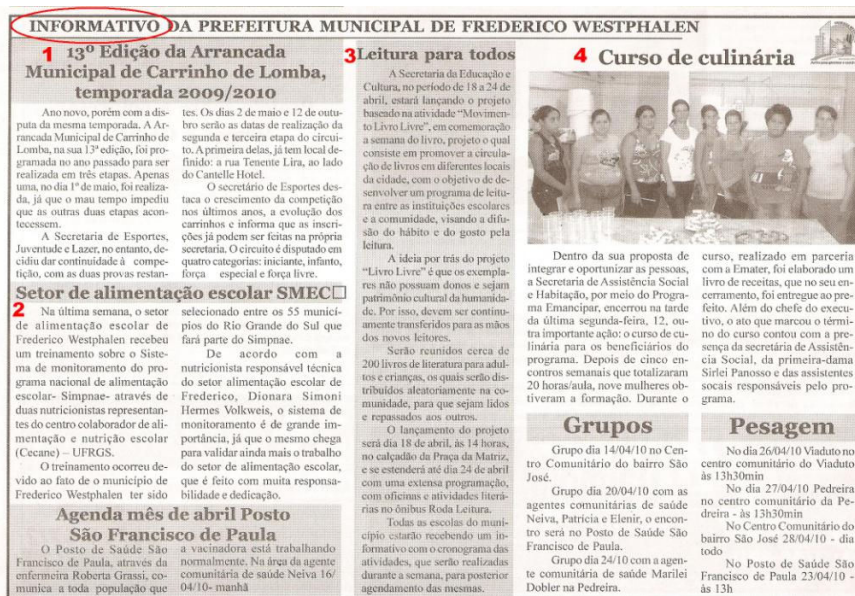
Figura 5 – Informativo da Prefeitura Municipal de Frederico Westphalen

O Jornal Folha do Noroeste também teve duas edições, dia 09 de abril. Não houve publicação de nenhum relise. A segunda edição datada de 16 de abril continha três relises. As publicações encontravam-se dentro do espaço editorial, nas páginas 13 e 20 desta última edição. Nota-se que não há grandes mudanças nos relises.