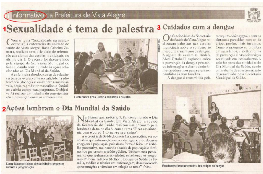
Figura 11 – Informativo da Prefeitura de Vista Alegre