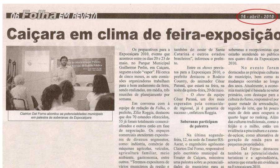
Figura 1 – Caiçara em clima de feira-exposição

O Jornal Folha do Noroeste também teve duas edições durante o período, sendo em 09 de abril, onde não houve a publicação de nenhum relise e, no dia 16 de abril, em cuja edição aparece uma matéria onde notamos a presença de um relise, mas este foi incorporado na matéria.